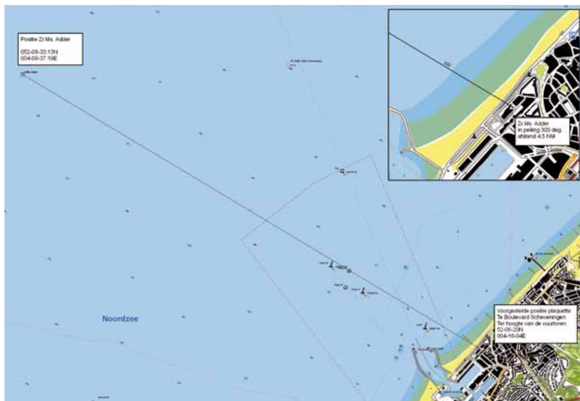
De huidige positie van het wrak van Zr. Ms Adder, voor de Scheveningse kust.

Inmiddels is het voor de bemanning bij de vloedstroom en de heersende zuidzuidwesten wind onmogelijk om de monitor te naderen.